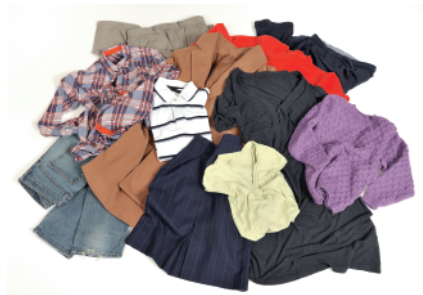
TEXTILES D'HABILLEMENT MÊME USÉS OU DÉCHIRÉS

▶ JE DÉPOSE DANS UNE BORNE OU À UNE ASSOCIATION LES TEXTILES, LINGE DE MAISON, CHAUSSURES