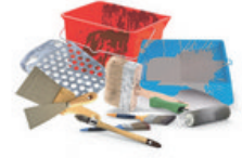
Outils de peinture