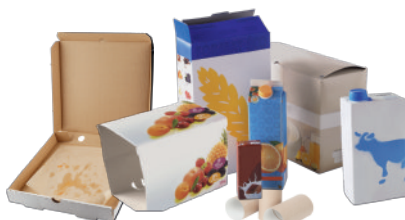
BRIQUES ALIMENTAIRES, CARTONNETTES Petits cartons fins, maximum de la taille d'une boîte de chaussures