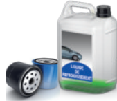
Entretien véhicule antigel, filtre à huile