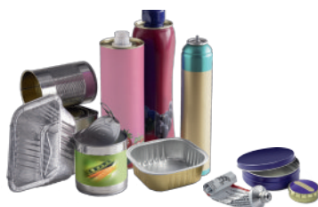
EMBALLAGES EN MÉTAL Boîtes de conserve, canettes, aérosols, barquettes en aluminium