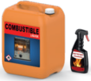
Chauffage, cheminée et barbecue