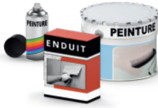
Bricolage et décoration peinture, vernis, colle