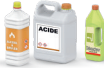
Entretien spécifique maison déboucheur, soude, acide