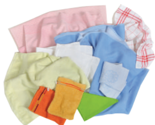
LINGE DE MAISON