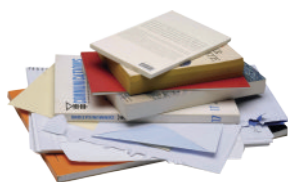
PAPIERS Journaux, magazines, publicités, catalogues, courriers, enveloppes, cahiers, livres