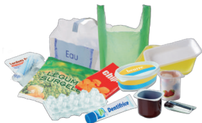
TOUS LES AUTRES EMBALLAGES EN PLASTIQUE Pots, boîtes, barquettes, sachets, sacs, films plastiques