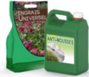
Jardinage engrais, fongicide