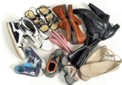
CHAUSSURES ATTACHÉES PAR PAIRE