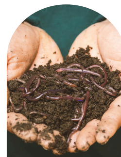
9 à 12 mois de compostage